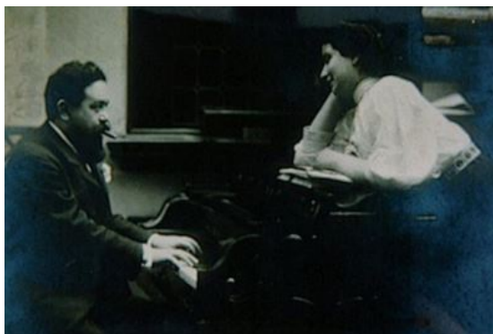
Isaac Albéniz con su hija Laura