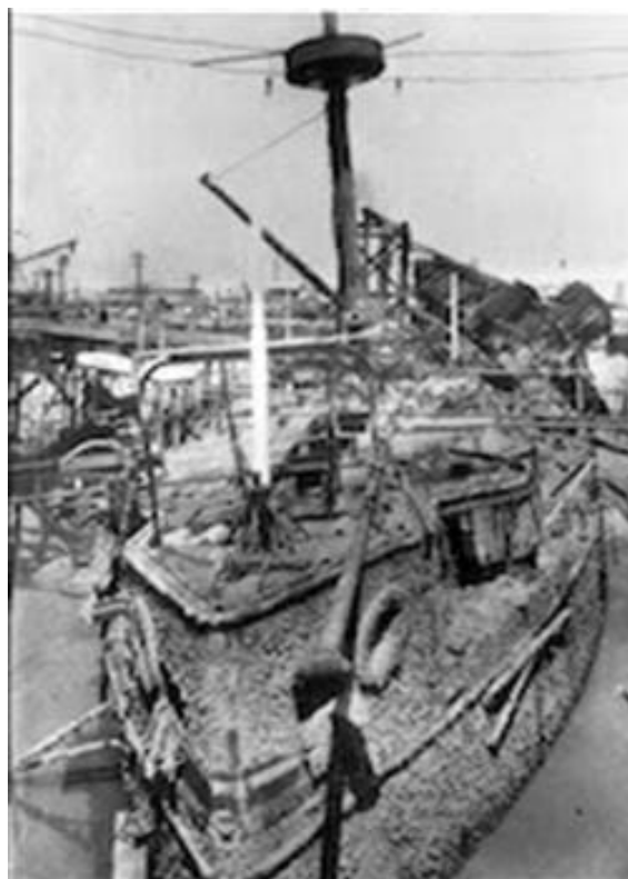
Acorazado USS Maine. (ACR-1)