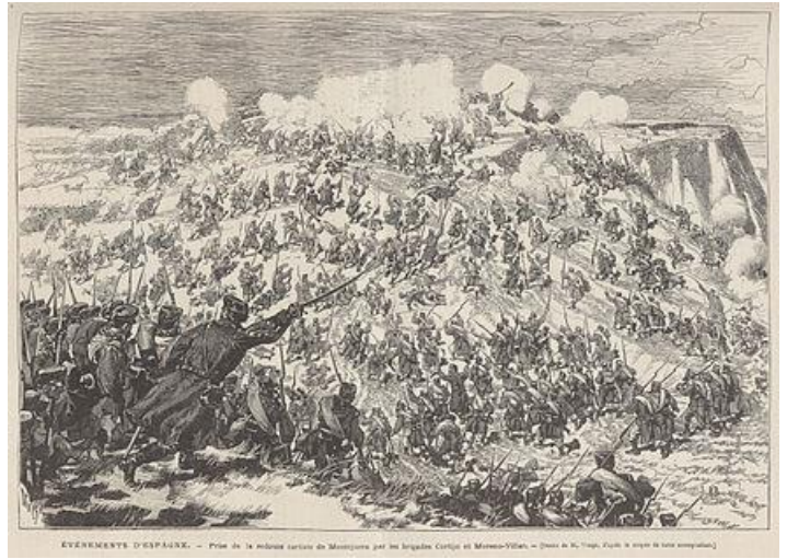
M. Vierge, Batalla de Montejurra (1876) © Wikipedia.

recuerdo aquel año y medio que mi hermano estuvo en el Norte. Estella, Tafalla, Somorrostro, Monte Esquinza y otros, eran nombres de poblaciones que nos sobresaltaban a cada momento.