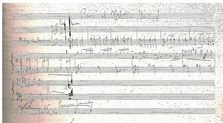
Manuscrito de las "Malagueñas murcianas" del acto 2 de María del Carmen.