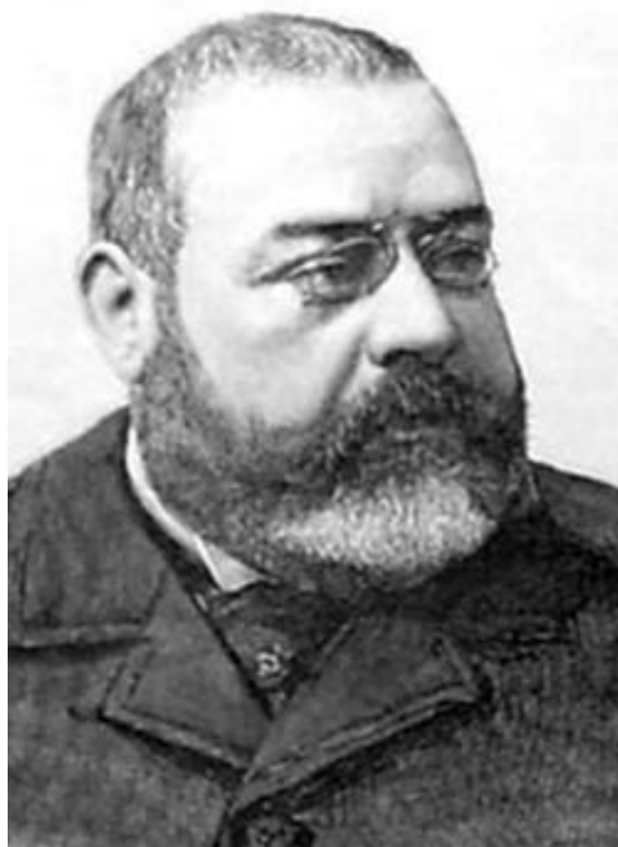
José Feliú y Codina