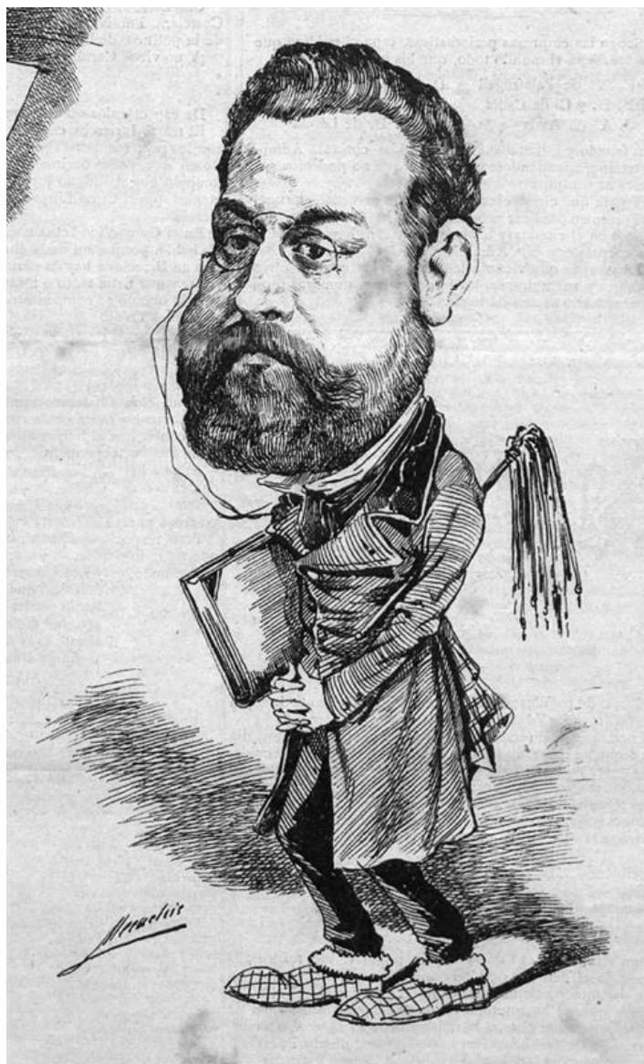
Mecachis, Caricatura de José Feliú y Codina en La Semana Cómica , 17 de agosto de 1888.

Sin considerar a La Dolores y María del Carmen como óperas y a la música incidental para Miel de la Alcarria , de una relación si no completa al menos significativa de unas 39 obras para la escena, se advierten comedias (11), dramas (8), zarzuelas (5), revistas (2) junto a otras piezas con denominaciones como comedia dramática, comedia de magia, entremés, farsa grotesca, “joguina”, rondalla, paso de comedia, etc. Realizó unos 14 estrenos en el Teatro Catalá (Romea), ciertamente debido a la cercanía con su director artístico, Serafí Pitarra, quien estuvo 25 años en el puesto. Siempre en Barcelona, sus estrenos también se efectuaron en el Circo (3), Bon Retiro (2), Novedades (2), Tívoli (1) y en Madrid en el Español (4), Comedia (2) y La Bolsa (1).