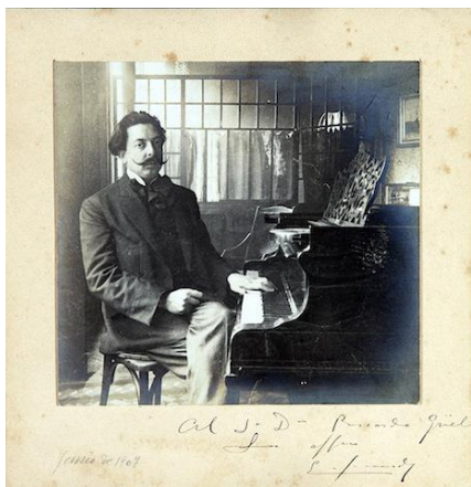
Enrique Granados en 1907.

24 de abril - Llega a Valencia para los conciertos de los días 26 y 28.