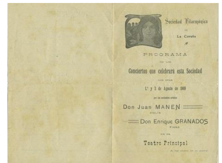
Programa de mano de los conciertos de Granados y Manén en la Sociedad Filarmónica de La Coruña (1909).

21 de mayo - Se informa de la contratación de Granados para una gira de conciertos de