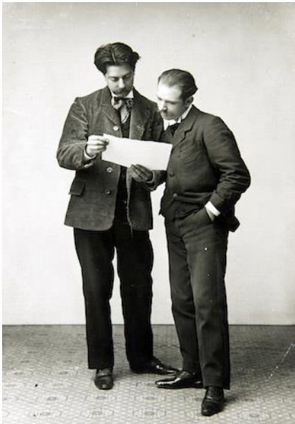
Enrique Granados y Pau Casals.