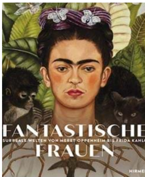
Fantastische Frauen © 2020 by Hirmer Verlag

Por primera vez, se hace justicia y se rompe este inaceptable silencio con una muestra que reúne 260 obras de 34 artistas femeninas de 11 países, cedidas por 80 instituciones y coleccionistas de Europa, México y Estados Unidos. Entre las contribuciones hay trabajos de Frida Kahlo y de Louise Bourgeois, pero también de artistas menos conocidas, como Leonor Fini, Alice Rahon y Kay Sage.