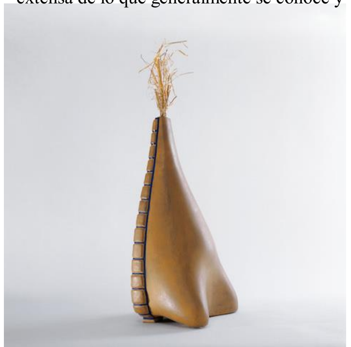
Meret Oppenheim, Venus prehistórica, 1962 (1933),.

En el programa uno se topa con temas familiares del surrealismo que, sin embargo, revelan lados completamente nuevos al invertir la perspectiva. En lo relativo a la diversidad del espectro estilístico y de contenido cubierto por las obras, esta exposición no solo es recomendable, sino que es también