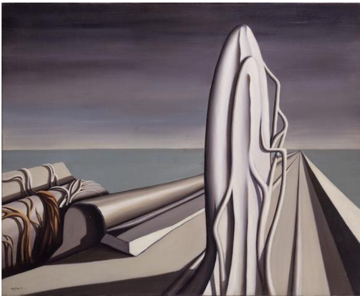
Kay Sage, A la hora acordada (1942). © 2020 by Estate of Kay Sage/VG Bild-Kunst, Bonn.