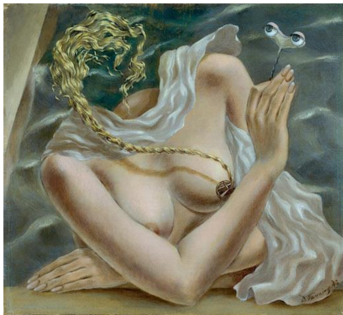
Dorothea Tanning, Tensión (1942).