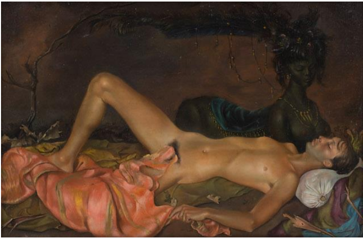
Leonora Fini, Deidad chthoniana vigilando el sueño de un joven (1946).