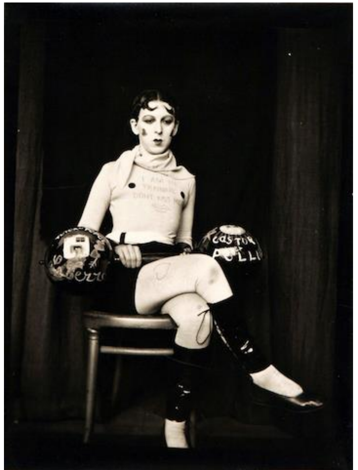
Claude Cahun, Estoy entrenando ... No me beses (ca 1927). © 2020 by Claude Cahun.