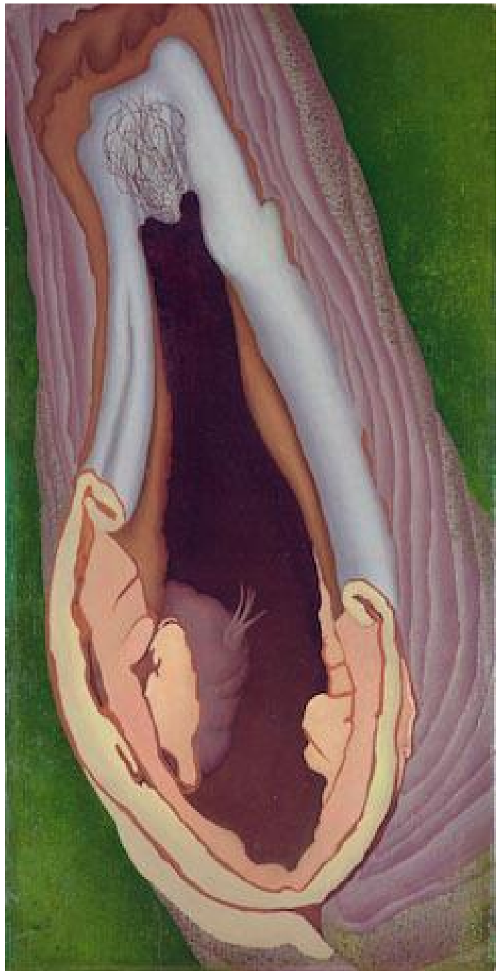
Ithell Colquhoun, Anatomía de un árbol (1942). © 2020 by Samaritans, Noise Abatement Society & Spire Healthcare.

Claude Cahun (1894-1954) también se retrata consciente de sí misma, pero de forma andrógina, en sus fotografías en blanco y negro de pequeño formato. A veces se muestra con una mirada feroz y con el pelo corto; otras veces con la cabeza rapada y sosteniendo pesas en su regazo ( Autorretrato , 1927). Más tarde Cahun se rebelaría contra la ocupación nazi de la isla de Jersey, sería detenida y sentenciada a muerte en 1944. La condena no se cumpliría, pero padecería los efectos de la detención hasta su muerte.