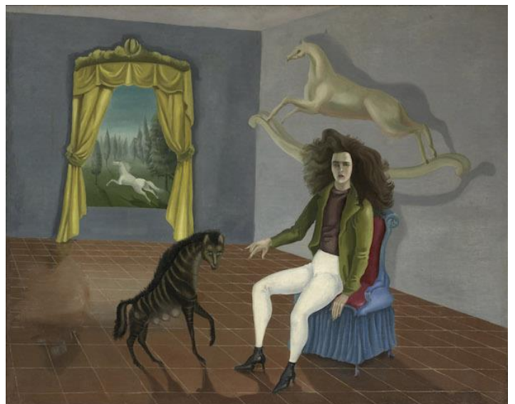
Leonora Carrington, Autorretrato en el Auberge du Cheval d'Aube (1937/38).