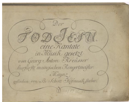
Georg Anton Kreusser, cantata Der Tod Jesu , primera publicación del Hofmusikstecher Bernhard Schott.

Sin embargo, para Bernhard Schott esto aparentemente no representaba ninguna mayor preocupación. Él seguiría trabajando aplicadamente y concurriría dos veces al año a la Feria de Francfort. En 1791 había adquirido una segunda casa por casi 6.100 gulden (unos 305.000 euros de hoy). La editorial tiene hoy todavía allí su sede central, en el número 5 de la Weihergarten de Mainz.