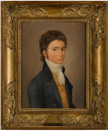
Anónimo, Retrato del joven Ludwig van Beethoven (mediados del siglo XIX). © 2020 by Schott Music GmbH & Co.

impresión de partituras en Mainz. Dos años más tarde, y seis días después de Epifanía , abrió oficialmente su editorial en la Rosengasse de esa ciudad, como le anunciaba en una carta al canónigo de la iglesia parroquial de San Bartolomé, de Francfort del Meno, Johann Georg Battonn; el padre de éste vivía al parecer en la misma casa de Schott. Dentro de 14 días pondré en sus manos mi primer catálogo. Por favor tome nota de la fecha , le anunciaba. Ludwig van Beethoven vendría al mundo no muy lejos, río abajo, un poco más al norte, en Bonn, el 17 de diciembre de 1770.