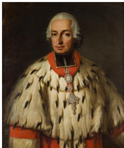
Friedrich Karl Joseph von Erthal.

aprovechar el momento oportuno. En 1774 es consagrado nuevo arzobispo de Mainz y príncipe elector Friedrich Karl Joseph von Erthal; amante de las artes, principalmente de la música, y así continuaba floreciendo la vida cultural en esa