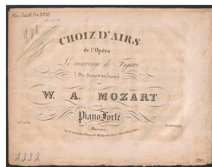
Wolfgang Amadé Mozart, Selección de Le Nozze di Figaro en reducción para piano. © 2020 by Schott Music GmbH & Co.

Paulatinamente el programa de la editorial se iría emancipando de la música regional. Así serían publicadas obras de la Escuela de Mannheim, obras para piano de Muzio Clementi y piezas de Ignaz Pleyel, quien hasta finales del siglo sería el autor con el mayor número de composiciones en la editorial. También el nombre de Wolfgang Amadé Mozart desempeñaría aquí un importante papel. Schott publicaría ediciones de las sonatas para piano en re mayor KV 175 (1785) y en mi bemol mayor KV 271 (1793), las sonatas para piano en si mayor KV 333 y en re mayor KV 284, así como la sonata para piano a cuatro manos en do mayor KV 521 (1788), y numerosos arreglos.