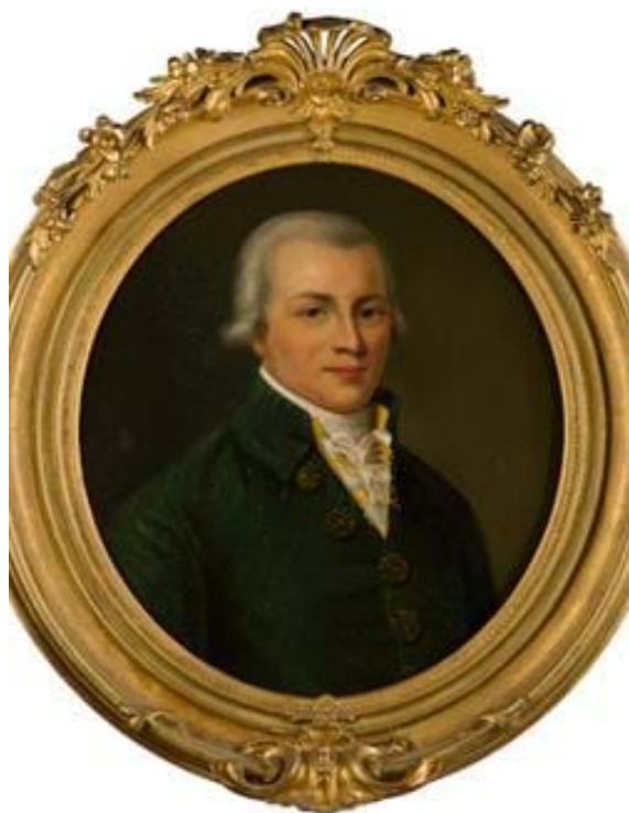
Bernhard Schott © by Schott Music GmbH & Co. KG

Todo comenzó en 1768 cuando Bernhard Schott, con 20 años de edad, daba a conocer en una circular de que se había instalado con un taller de grabado sobre planchas de cobre e