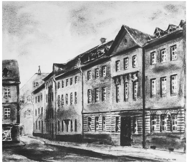
Sede de Schott Verlag en Weihergarten (1933).