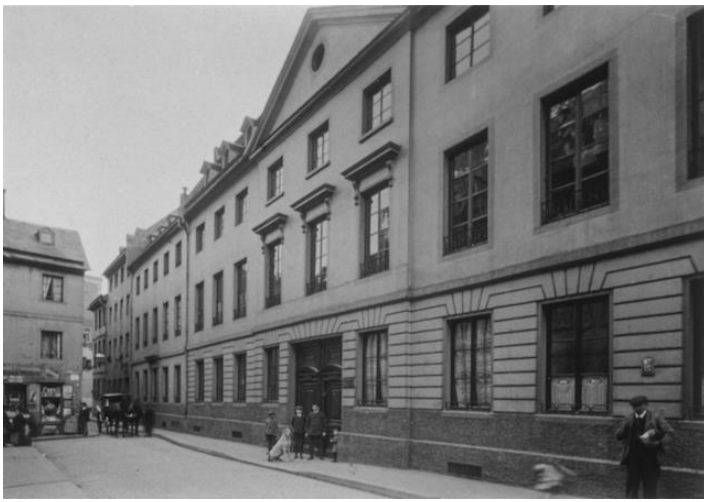
Sede de Schott Verlag en Weihergarten (1919).

el Cuarteto de cuerda op 16 de Paul Hindemith. El mismo año desarrollaría Arnold Schönberg el estilo de composición dodecafónica. Ese riguroso principio formal complementaría las corrientes vanguardistas de aquel tiempo.