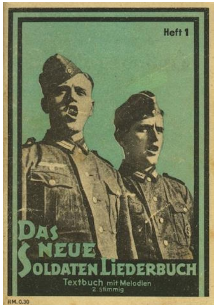
Soldatenliederbuch (1938).