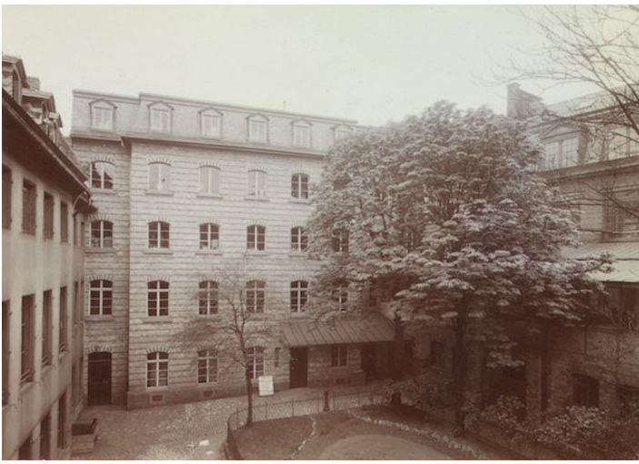
Sede de Schott Verlag en Weihergarten (1909).

seudónimo utilizado por el padre del compositor. El seudónimo lo había compuesto con el primer nombre del personaje principal de la ópera y con el de la editorial de Mainz. La brillante carrera de Korngold sería cercenada brutalmente por el ascenso al poder de Adolf Hitler en 1933 y la prohibición impuesta por su régimen antisemita de ejecutar públicamente sus obras. En 1934 lo reclutaría Max Reinhardt para el rodaje de la película A Midsummer Night's Dream en Hollywood, donde Korngold se establecería definitivamente en 1938.