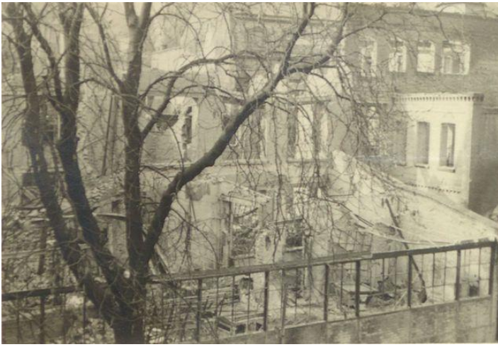
Sede de Schott Verlag en Weihergarten tras los bombardeos aliados (1944).

bombardeos de los días 12 y 13 de agosto de 1942, pero en septiembre y octubre de 1944 varias bombas incendiarias causarían cuantiosos destrozos. Primero se incendiaría el techo del taller de composición, después sería destruida totalmente la imprenta, así como un depósito, se quemarían las existencias de papel y miles de volúmenes de partituras listos para ser distribuidos.