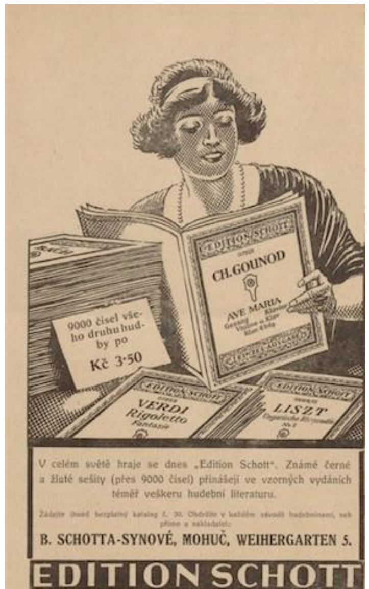
Anuncio de la Edición Schott Single Edition (1 de diciembre de 1913). © by Schott Music GmbH & Co. KG.

Poco después invertirían en una fábrica de cuerdas (para instrumentos musicales y para raquetas de tenis) en la localidad de Markneukirchen, en el centro de fabricación de instrumentos musicales de Vogtland (Sajonia), el denominado rincón de la música (Musikwinkel) en la frontera con Bohemia (hoy República Checa), así como en la constructora de violines Frank Reiner Geigenfabrikation und Veredlung de Hamburgo. Pero todos estos negocios no llevarían al éxito esperado ante aquellos tiempos de dificultades coyunturales; costaban mucho dinero y amenazaban con arruinar a la editorial.