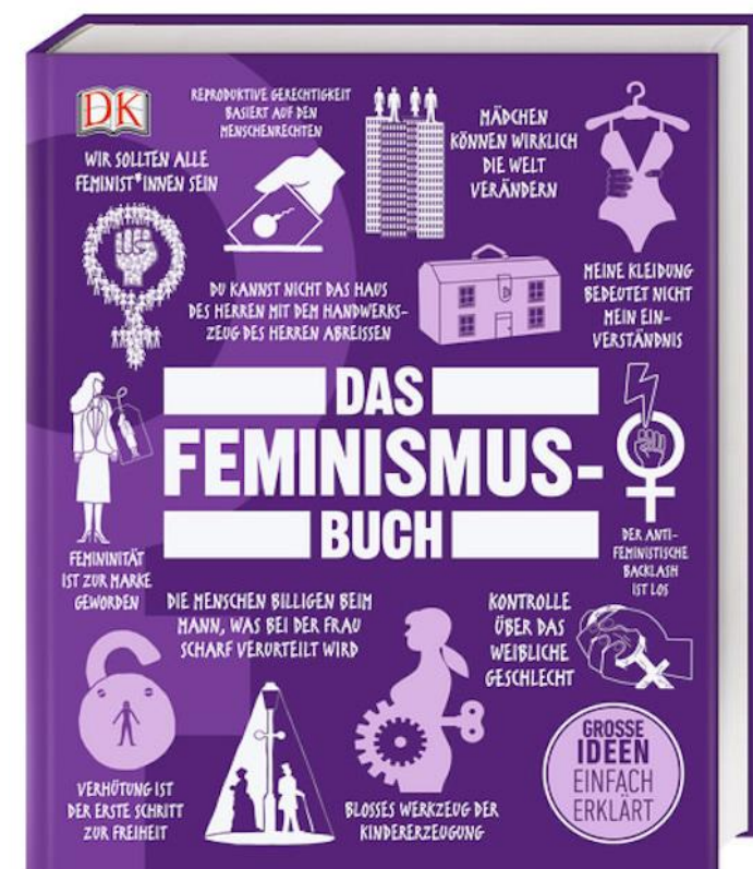
Georgie Carrol, Big Ideas. Das Feminismus Buch . © 2020 by DK Dorling Kindersley.

La pandemia del coronavirus devolvió repentina e involuntariamente a las mujeres a la cocina y a los viejos tiempos, a aquellos modelos tradicionales de la década de 1950 o anteriores aún (los de las tres K, como se los denomina usualmente en los países de habla germana: Küche, Kinder, Kirche , cocina, niños, iglesia); una reacción violenta que ha hecho mucho daño y que es muy discutida actualmente aquí.