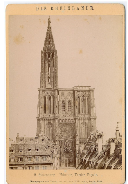
Sophus Williams, fotografía de la fachada de la Catedral de Estrasburgo, Berlín: 1880. © Dominio público / Wikipedia.

A continuación, se abren los ejes de construcción y se colocan en ellos las plantillas, con las que se transfiere la elevación. Para ello, los canteros utilizan una regla, compases y ángulos, los escultores el compás de agarre y el punteador, con cuyos brazos orientables se puede tomar el original en tres dimensiones y transferirlo al bloque. Una vez establecidos los puntos de referencia esenciales, comienza el trabajo. Mientras se comprueban constantemente las especificaciones geométricas exactas del original, se realiza una aproximación cada vez más precisa al volumen deseado.