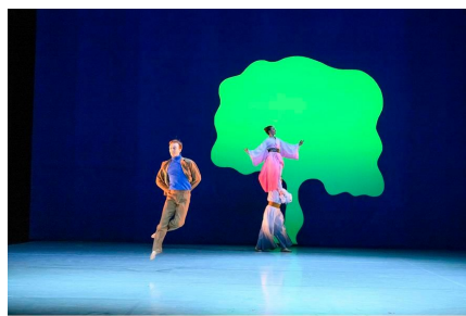
Freedom, coreografía de Marco A. Carlucci. © 2021 by Krefeld Stutte.

En Freedom , con la intervención de Jessica Gillo , Duncan