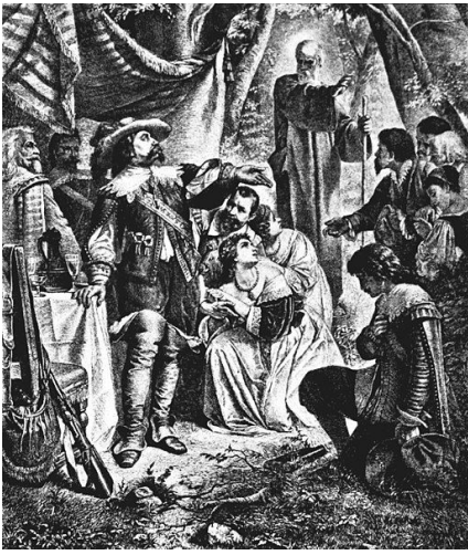
El Príncipe Ottokar perdona a Max. Tercer acto de 'Der Freischütz'. The Victrola book of the opera (1917).

severo castigo?) El adagio maestoso se convierte en un andante quasi allegretto en 6/8 para conmutar la pena al cazador Max, en la tonalidad de si menor, relativo de re mayor ( Doch sonst stets rein und bieder war - pero que siempre fue puro y virtuoso) con el acompañamiento de la flauta primera. Max y la concurrencia agradecen el perdón del príncipe Ottokar ( Die Zukunft soll mein Herz bewähren - El futuro protegerá mi corazón,) en la misma tonalidad de si, pero en modo mayor.