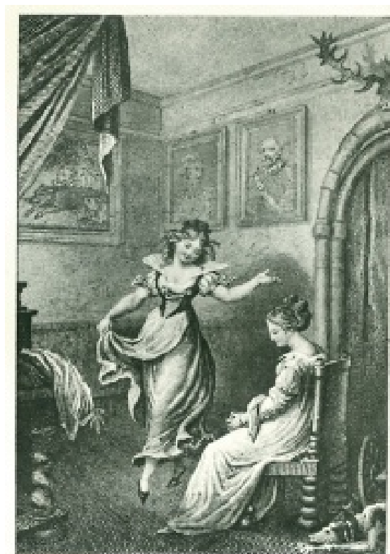
DER FREISCHÜTZ. Ännchen. Agathe. Gewiss, gewiss, mein Herz, gewiss, Gewiss, mein Herz, gewiss, mein Herz, Gewiss, mein Herz, gewiss, mein Herz...

A pesar de que la voz de Ännchen es más ligera que la de Agathe, cuando las voces corren paralelas, Agathe va por encima de Ännchen (sol#-mi sobre la palabra gewiss y si central-si grave en la semicadencia a la dominante). En el punto culminante del dueto, Agathe ha de cantar un la agudo mantenido sobre el arpeggio descendente de Ännchen fa#-re-la-fa#-re.