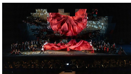
La Traviata de G. Verdi. Dirección musical,

Desde el punto de vista de la música el mayor problema ha sido la 'concertación' de Bortolameolli que dirigió una orquesta apagada ya desde el vamos a la que cuando quiso conferir energía sólo logró volumen, aunque todos los instrumentos estuvieran en su sitio.