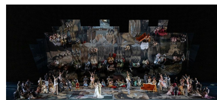
La Traviata de G. Verdi. Dirección musical, Paolo Bortolameolli. Puesta en escena: Henning Brockhaus. Macerata Opera Festival 2021.

Vitale parecería tener una buena voz, de color adecuadamente oscuro. Lamentablemente se le escucha bien y es persuasivo sólo en las medias voces y en los centros porque en los otros registros suena o engolado o abierto y el agudo se estrecha. También nos tocó la cabaletta doble (que además de ser la más fea de cuantas Verdi escribió y aunque tuvo el valor de interrumpirla por motivos teatrales me provoca siempre la misma pregunta: ¿por qué, cuando había voces que podían salir airoso de la empresa de una versión 'sin cortes' los cortes se practicaban y ahora no?).