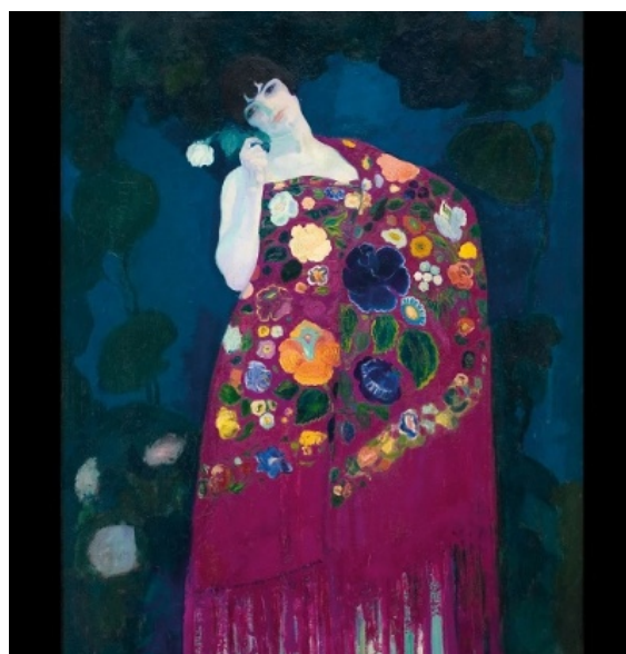
Granadina, Anglada Camarasa, c. 1914 © 2023 by MNAC de Barcelona

Entre las diversas exposiciones que presenta actualmente el Museu Nacional d'Art de Catalunya me llamó la atención la de Anglada Camarasa. El archivo premeditado . Hermen Anglada Camarasa (Barcelona, 1871 - Puerto de Pollensa, Mallorca, 1959) fue, según explica el propio museo en la presentación de la exposición: "el artista catalán con mayor proyección internacional entre Marià Fortuny y Joan Miró" y destaca "la relevancia de Anglada Camarasa durante los años previos y posteriores a la Primera Guerra Mundial, cuando se convirtió en el artista más internacional después de Marià Fortuny".