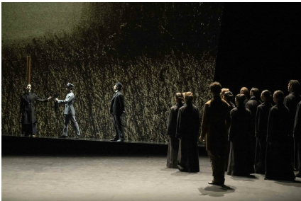
Mata Hari de Robert North. © 2023 by Theater Mönchengladbach.