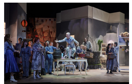
«Cinderella», régie de Christian Thausing.

El cambio de vestuario de Ella es todavía más impresionante. Empieza vistiendo unos vaqueros azules y un amplio jersey de punto de color claro que le llega casi hasta las rodillas. Sus dos muñecos de peluche (que siempre lleva a la cama) se transforman en un mono y un perro de carne y hueso. Tras la metamorfosis, ambos animalitos son interpretados por el conjunto de baile, el jersey de Cinderella se desprende en un impresionante juego de luces cuando gira vertiginosamente.