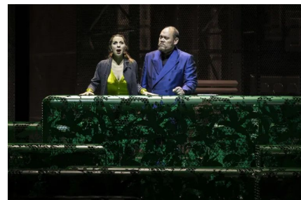
'Beatrice di Tenda' de Bellini. Dirección musical, Mark Wigglesworth. Dirección escénica, Peter Sellars. París, Opéra National, febrero de 2024.

Ah, y luego las numerosas incongruencias ridículas como dejar que Pene Pati haga de chulo de pueblo ante los hombres armados (que no hacen nada por apresarlos) cuando Beatrice clama (en dos ocasiones) algo así como «no hay aquí ningún hombre para defenderme». Tales hombres armados parecen más interesados en frenar la ira de Filippo que en apresar a Orombello, como si se tratase de una pelea de discoteca más que de un crimen de estado. De suerte que el dramático concertante que cierra el primer acto se convierte en una escena chusca entre chulitos de pueblo. O los gestos repetidos y repetitivos entre Orombello y Agnese. O la inmensa inutilidad de la escena inventada por el director de escena supuestamente para ilustrar el preludio belliniano (¿¿Pero cuándo nos dejarán los directores de escena escuchar tranquilos los preludios que fueron escritos para ser escuchados a telón cerrado??).