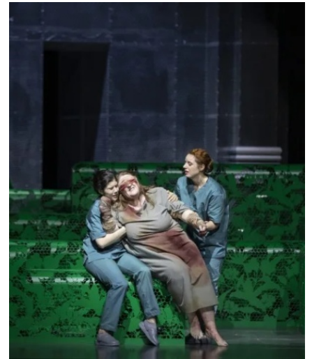
Sellars, Beatrice di Tenda

Más de medio milenio después, uno de los grandes nombres de la lírica, el siciliano Vincenzo