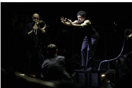
Demis Volpi «Surrogate Cities».

Prácticamente todo el elenco de la compañía Ballett am Rhein bailó Surrogate cities ante un público fascinado por la energía y las luces de la ciudad.* La platea se puso espontáneamente de pie al final de la función para ovacionar y aclamar al unísono a Demis Volpi, así como a sus bailarinas y bailarines, que han mostrado una vez más su excelente estado físico y anímico.