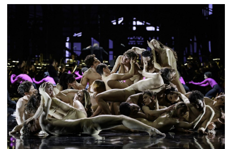
Demis Volpi «Surrogate Cities».

Al combate le siguen los excesos. Una gigantilla (cabezudo), vestida con un largo abrigo negro, domina la escena; un galán muestra sus músculos, posan uno frente al otro y se quitan la ropa. Hombres y mujeres (en leotardos color piel) caen unos sobre otros, formando en ese orgiástico entrevero una masa ondulante con los brazos sobresaliendo a fuerza de impulsos y convulsiones.