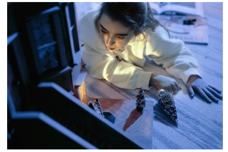
Gregory Crewdson, "Untitled", from the series: «Early Work», 1986-1988.