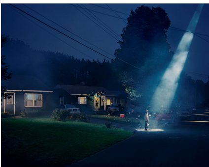
Gregory Crewdson. "Untitled", From the