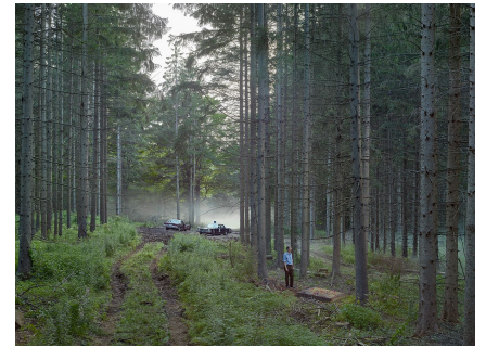
Gregory Crewdson, "The Mattress", from the series: «Cathedral of the Pines», 2013-2014.

La melancolía y la soledad de los enigmáticos cuadros de Edward Hopper se reflejan con la misma claridad que la pesadilla de base psicoanalítica de las películas de David Lynch. Paralelamente a la muestra, el Albertina de Viena proyecta en el cine aire libre de sus jardines los filmes Blue Velvet (Terciopelo azul, 1986), de Lynch, y Safe (1995), de Todd Haynes .