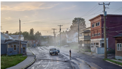
Gregory Crewdson. "Starkfield Lane", from the series: «An Eclipse of Moths», 2018-2019.

El artista describe la situación de los lugares postindustriales abandonados a través del contraste entre el ambiente luminoso plasmado en colores brillantes y los motivos desoladores de la vida cotidiana. Como destacado conocedor de la historia del arte, Crewdson crea sus escenas en un gesto autorreflexivo en la interfaz con otros géneros artísticos.