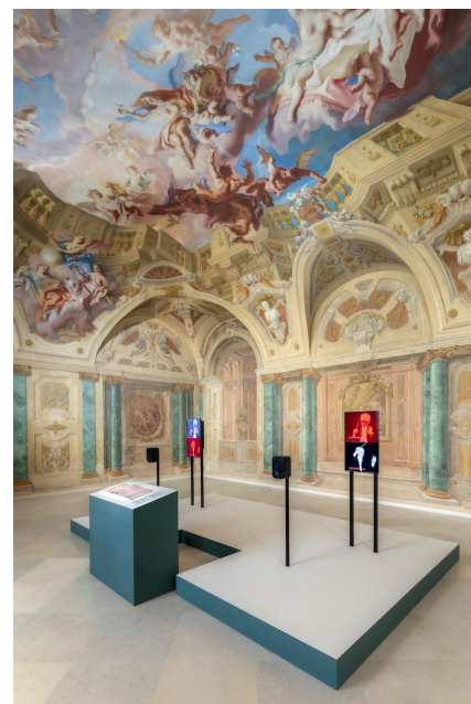
Instalación «CARLONE CONTEMPORARY: Dara Birnbaum Bruckner: Symphonie Nr. 5 B-Dur».