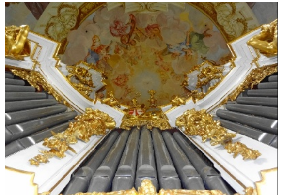
Órgano Bruckner de la Abadía de San Florián

La vida y la estética de la obra del compositor Anton Bruckner , serán analizadas por 24 académicos en una conferencia multidisciplinaria de cuatro días en el bicentenario de su nacimiento. El XIII. Congreso Internacional Bruckner hoy y entonces se extenderá desde el próximo martes 20 hasta el viernes 23 de agosto en la Abadía de los canónigos agustinos de San Florián (Alta Austria), su hogar espiritual.